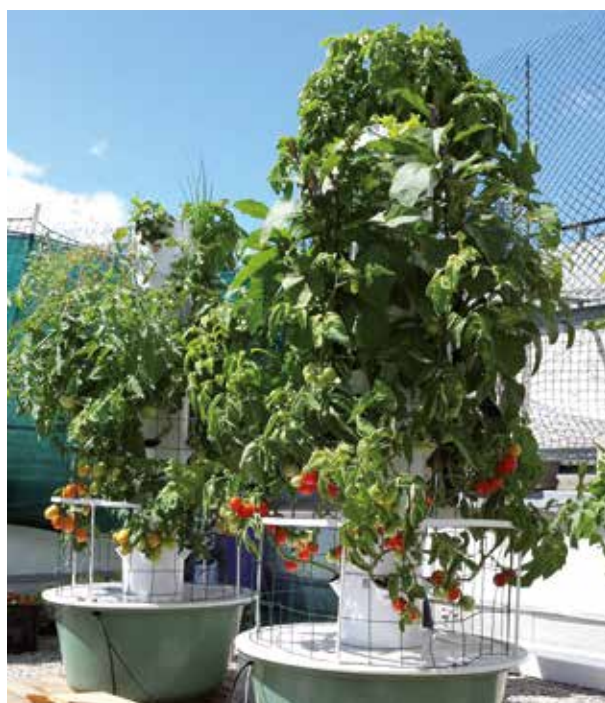
Paris 13 e (75)

À une échelle plus facilement reproductible, la SNI Île-de-France teste un système innovant de culture hors-sol sur les toits de deux résidences parisiennes. Les équipements - très légers - utilisent dix fois moins d'eau qu'une culture traditionnelle et sont connectés pour régler l'apport en nutriment et en eau. La production (fruits rouges, légumes, fleurs...), sans pesticide, sera vendue en circuit très court aux résidents, aux restaurateurs et aux supermarchés du quartier.